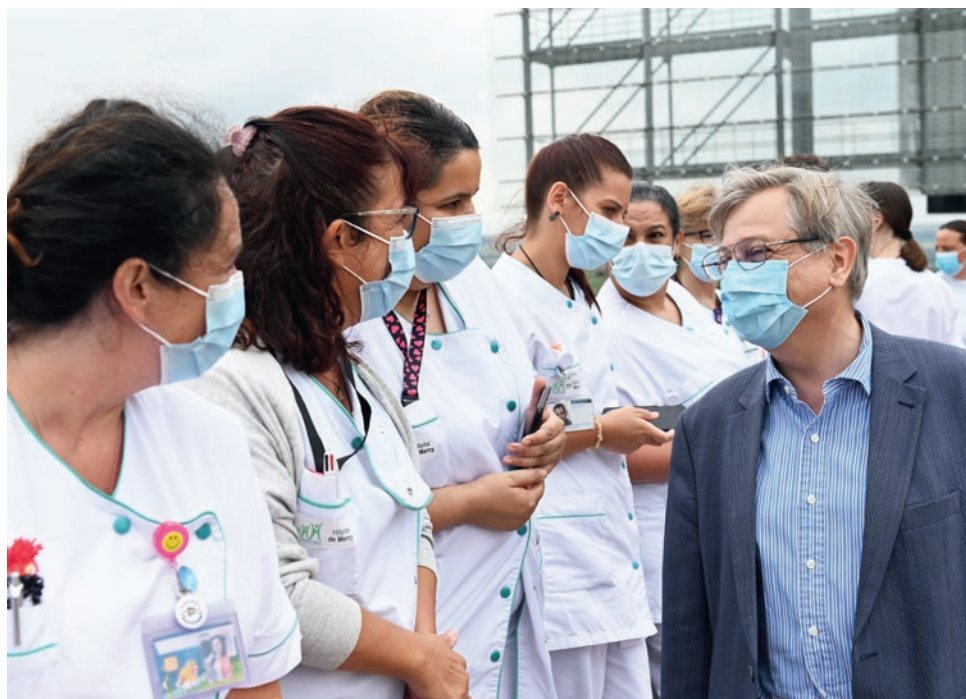
Le maire auprès des soignants, lors du vol des Alphajets de la Patrouille de France au dessus de l'hôpital de Mercy, le 17 juillet.

La carte donne accès, gratuitement, à un bouquet de spectacles, événements, expositions et autres rencontres culturelles et sportives, durant la saison 2020/2021. Cette carte leur permet également de bénéficier d'entrées gratuites et de tarifs préférentiels chez certains partenaires.