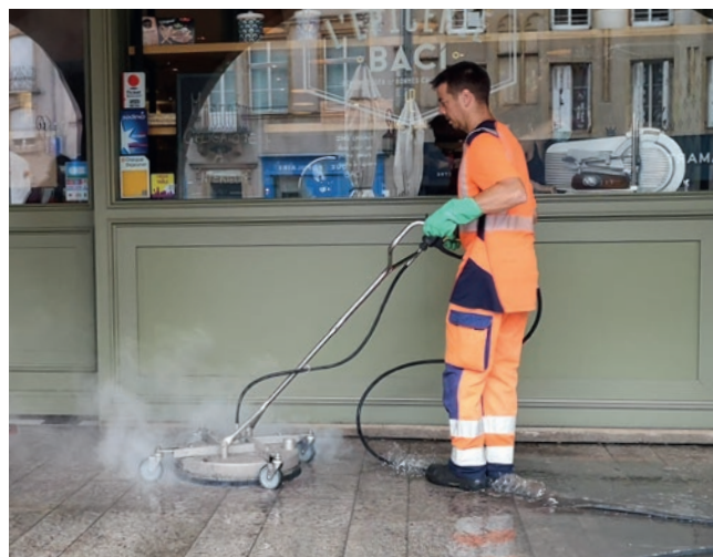
Les agents de la propreté ont réalisé en juillet dernier une opération de décapage place Saint-Louis, sous les arcades.

L'application mobile « Ville de Metz » Pour des espaces verts entretenus, des allées propres, des façades sans graffiti... Pensez à télécharger l'application « Ville de Metz ». Disponible gratuitement sur l'App Store et Google Play, cette application vous permet de signaler toutes anomalies constatées sur le domaine public. Depuis votre téléphone, alertez instantanément, en quelques clics, les services de la Ville et de la Métropole concernés.